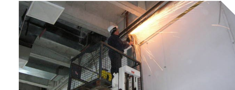
Imenovati TO ratom

Kojih nas? Ko su ti oni? Da ja dam bukvalni prevod: onaj što po ceo dan vozi onaj motocikl sa ramom isečenim na pola i zavarenim za kolica u kojima gura sekundarne sirovine, u svoje slobodno vreme