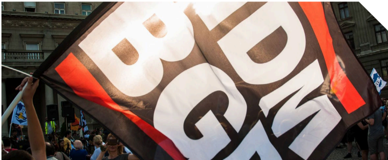
Imenovati TO ratom

Rilten uciteljneznalica.org društvena pitanja