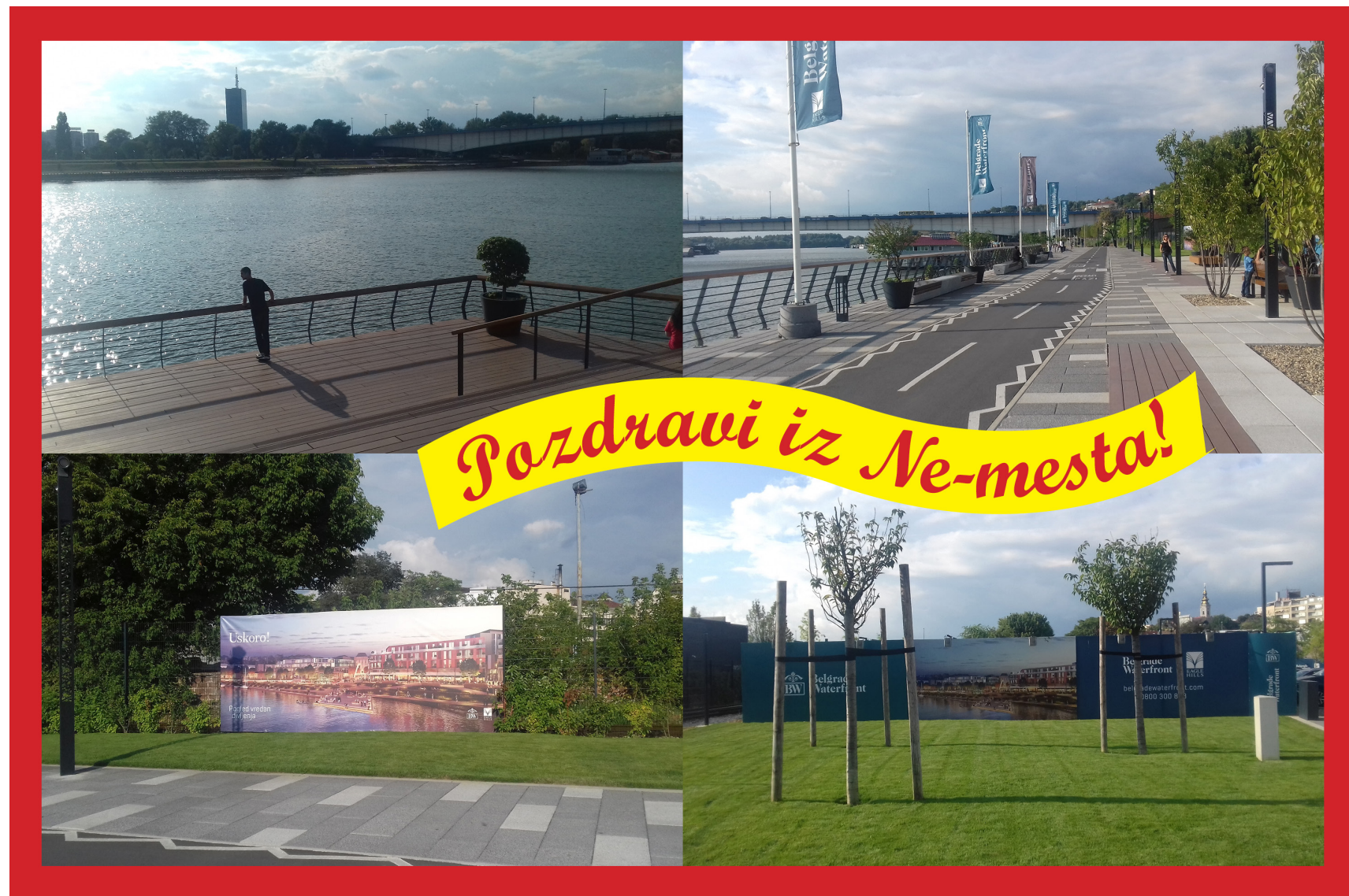
razglednica: vahida ramujkić

Posle mnogo godina parničanja, sud je presudio po zakonu, da je novi vlasnik preduzeća dužan da nam