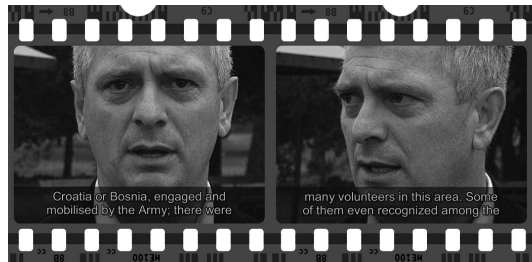
Croatia or Bosnia, engaged and mobilised by the Army; there were

1. Erich Fromm, Zdravo društvo , Kultura, Beograd, 1972. godine