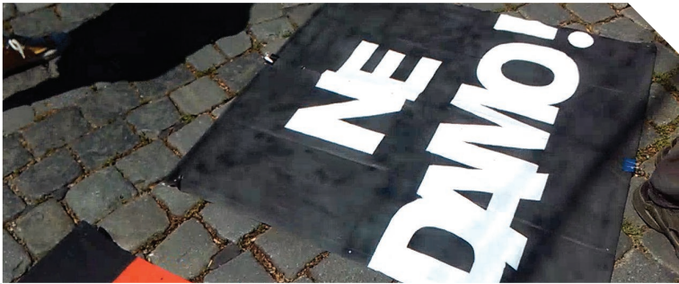
Imenovati TO ratom

U mojoj generaciji, 50% ljudi je uvek bilo za neki otpor, a 50% za liniju manjeg otpora da bi se preživljavalo. Ljudi su puni strahova. Prvo, bilo ih je sramota kad su dobijali otkaze, jedan obrok su jeli i čutali su, stideli su se da kažu da nemaju para. Sada, kad dolaze izvršiocu oni, ljudi i dalje gledaju da se sakriju, da komšije ne vide do čega je doveo sebe i svoju porodicu svojim nekim, misli, neznanjem i neumjećem. A nije to njegovo neznanje, to je jedna banda kriminalaca koja je na vlasti od devedesetih do današnjeg dana. Jer je ogroman kolač je bio bio u ruci, a to je ta društvena imovina, za koju ti naši vladari misle da su trajno opljačkali i stavili tačku na to. Ja sam ubeđen da će se jednog dana pojaviti mladi ljudi koji veruju u pravdu i koji će svoju očevinu koja je oteta kroz